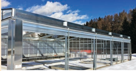
Seitliche Rolllüftung wahlweise von oben nach unten zu öffnen.