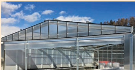
Giebelseitige Rollwand von unten nach oben zu öffnen (s.A.). Giebelausführung nach Bedarf.