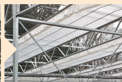
... über die einzelnen Binderfelder