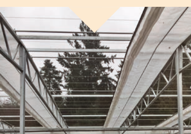
Schnelles Öffnen u. Schliessen ...