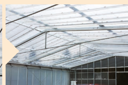
Wetterschutz bei geschlossenem Dach